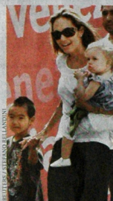
Kinder-Bild: Shiloh Jolie-Pitt