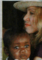
David gegen Goliath: Paparazzi lieben Madonnas Kind

Jolie-Pitt, Sean Preston Federline und Pax Jolie-Pitt. In diese Liste wird sich in Zukunft dann auch Kidmans Kind einreihen. Weil die Paparazzi und die Eltern es so wollen. Es geht schließlich um den Schein. Den wahren Pitt und Jolie, als sie das Geld, das sie am Abschuss ihrer Tochter verdienten, einem wohltätigen Zweck spendeten. Dem künftigen Kidman/Urban-Spross kann man wohl nur Trost spenden. „A star is born“, bevor er überhaupt zur Welt gekommen ist.